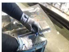
溶組課研修(スポット打点マーキング)