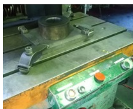
プレス課研修(100tプレス機)