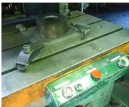
プレス課研修(100tプレス機)