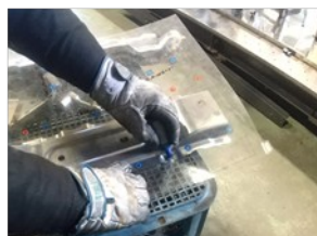
溶組課研修(スポット打点マーキング)