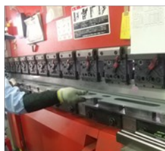
試作課研修(ブレーキプレス)