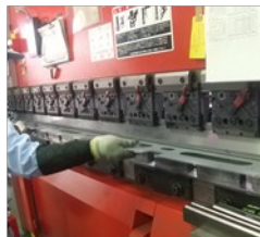
試作課研修(ブレーキプレス)